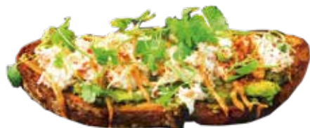
Snow Crab & Avocado 1380 ズワイガニ & アボカド