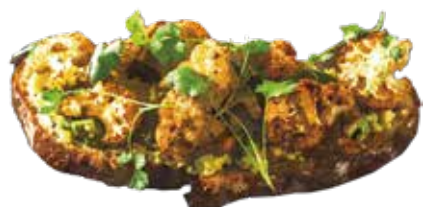
Vegan Cauliflower & Avocado 1180 ヴィーガンカリフラワー & アボカド