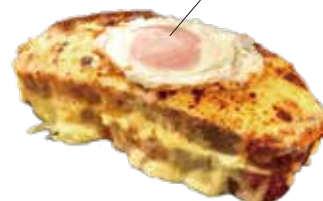
Croque Monsieur 980 クロックムッシュ