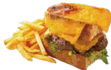
W Cheddar BBQ Patty Melt 1380 W チェダー BBQ パティメルト