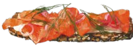
Smoked Salmon & Cream Cheese 1280 スモークサーモン & クリームチーズ