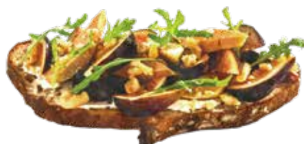
Foie Gras & Seasonal Fruits 1480 フォアグラ & 旬の果実